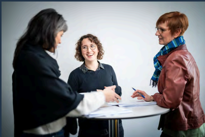
Interdisziplinäre Zusammenarbeit im DWS-Team

Unser Format Dialograum fand 2025 unter anderem zum Thema Zusammenarbeit statt. Ziel dieses offenen Austauschs war es, Mitarbeiter_innen zu stärken und ihnen Orientierung zu geben. Durch die Vermittlung von Wissen zu Organisations- und Besprechungsstrukturen sowie zu Methoden der Entscheidungsfindung werden Transparenz und Handlungssicherheit gefördert. Gerade in Zeiten von Unsicherheit kann dieses Wissen stabilisierend wirken und die psychische Gesundheit der Mitarbeiter_innen im Arbeitsalltag unterstützen.